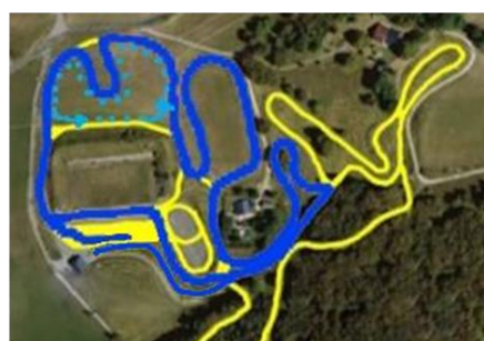
C D C D