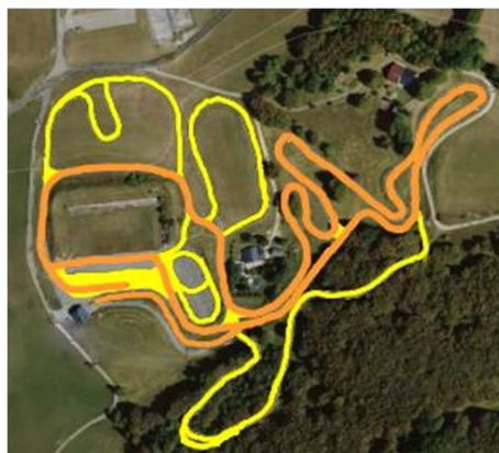
U17 D : 5x1.5