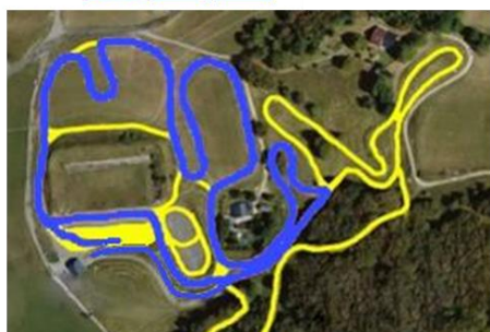
U15 H & D D C C